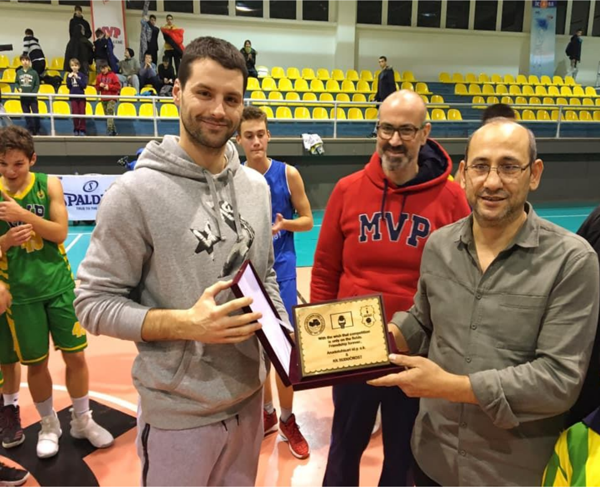
KK Buduónost Novi Sad Karşılaşması